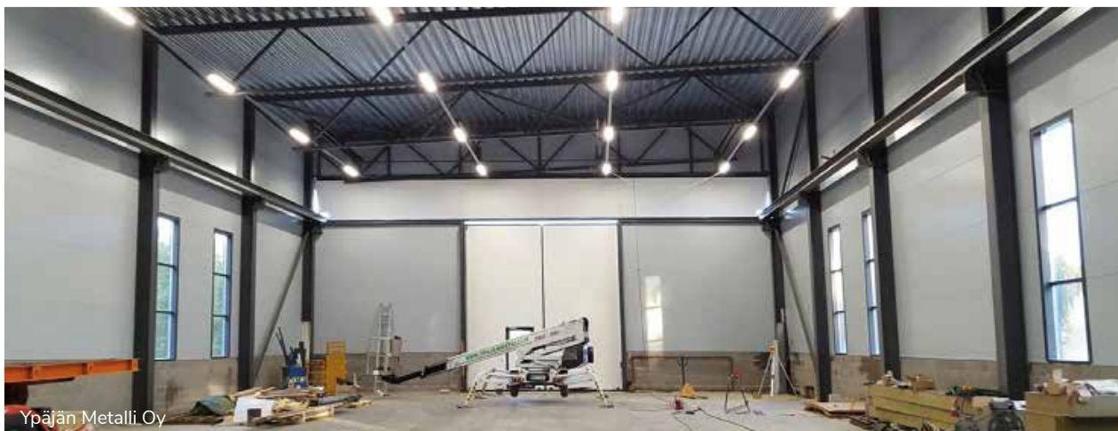
Ypäjän Metalli Oy