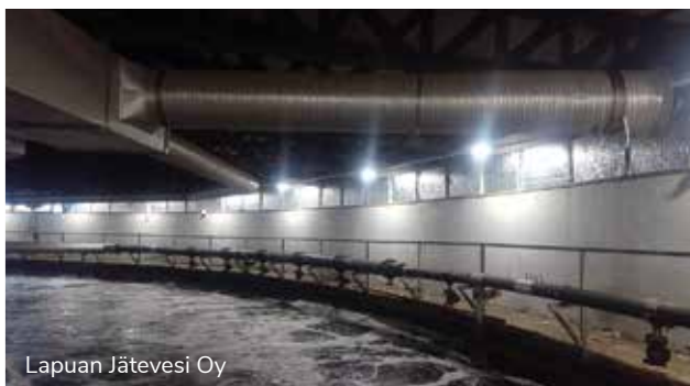
Lapuan Jätevesi Oy