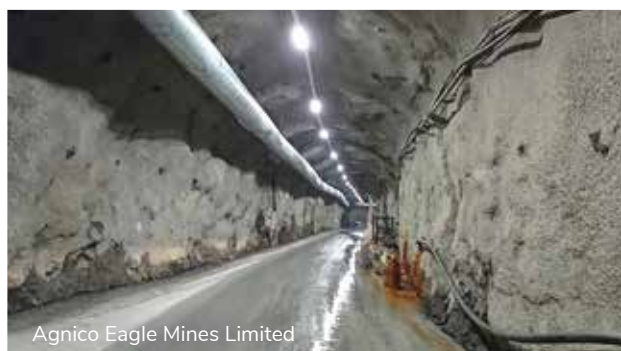
Agnico Eagle Mines Limited