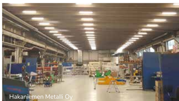
Hakaniemen Metalli Oy